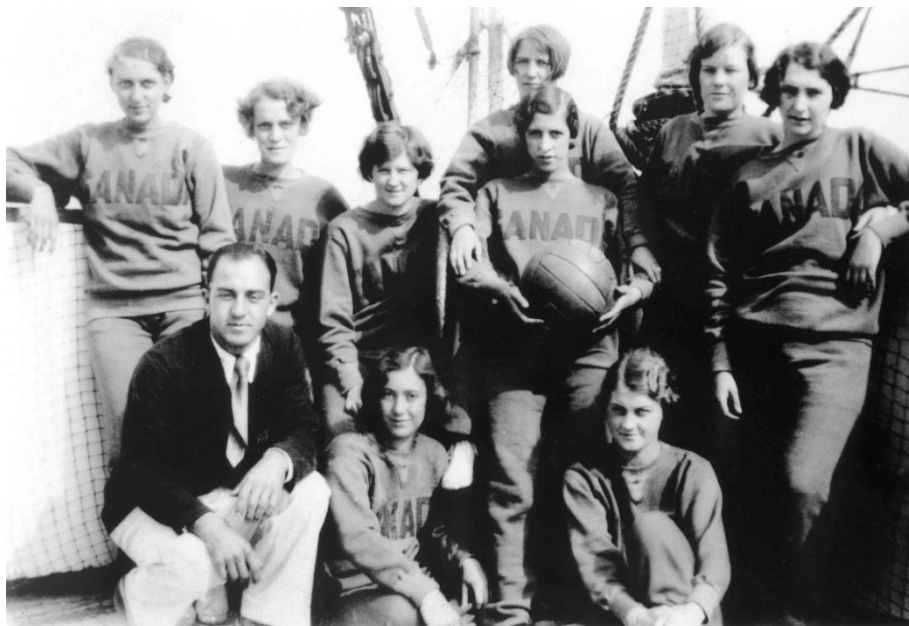
Сл. 6 Кошаркашки тим Канаде

У Амстердаму 1928. године МОК је уврстио 5 од 11 дисциплина које су биле на Женским светским играма, сматрајући да неким дисциплинама жене нису физички дорасле иако су у њима већ неколико пута учествовале. Милиат је потврдила да је број дисциплина неодговарајући и није била сигурна да ли ће бити додатно редукован на наредним Играма. Одлучила је да настави са организацијом Женских светских игара.