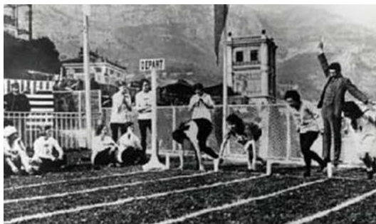
Сл. 3 Трка на 60 метара

Све златне медаље освојиле су такмичарке из Енглески и Француске, а све учеснице су добиле посебне медаље за учешће на Играма.