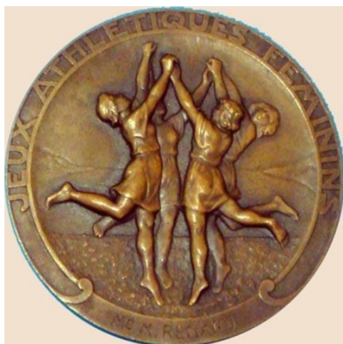
Сл. 4 Медаља са Игара у Монте Карлу

Игре пратило је 15.000 гледалаца, а доживеле су толики успех да је у августовском издању новина Спорт (Le Sportif) Милиат упоређена са Кубертемом 5 .