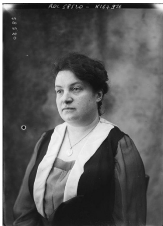
Сл.1 Алис Милиат

Алис Милиат је 1917. године основала Савез женског спорта Француске ( Federation des Societes Femines Sportives de France ) отприлике у исто време када је покренут Аустријски атлетски савез аматера. Први женски национални шампионат у атлетици одржан је 1918. године у Аустрији, а атлетика се развијала у Великој Британији, Пољској, Италији, Швајцарској, Белгији и Норвешкој и током рата 2 . Подстицај који је недостајао да би се покренуло законско тело за контролу