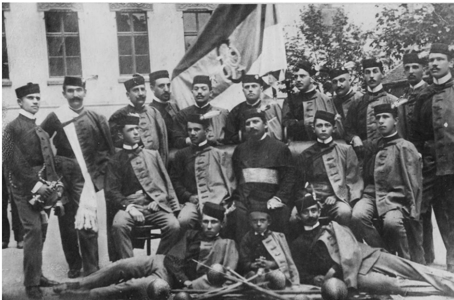
Слика 1: Прво Соколско друштво код срба, „Српски соко” Сремски Карловци, 1904. године. 10